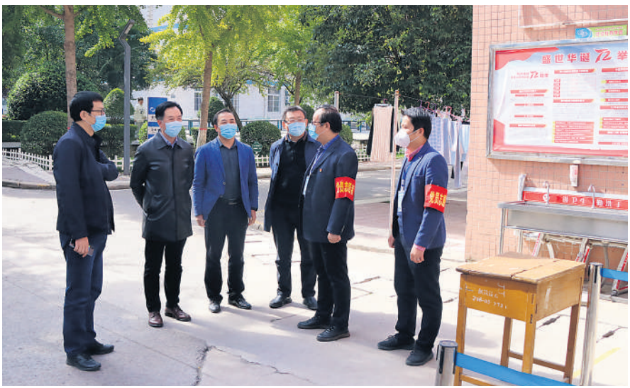
王书记一行检查校园防疫工作情况

本报讯(通讯员 郝付军 记者 王凯)面对新一轮新冠肺炎疫情防控的严峻形势,学校高度重视,坚决贯彻习近平总书记来陕考察重要指示精神,全面落实中央、陕西省部署要求,认真落实陕西高校新冠肺炎疫情防控工作视频会议精神,严格落实“外防输入、内防扩散”措施,通过紧盯“四个精准”,高标准推进新冠疫情防控工作,全力保障全校师生身体健康和生命安全。