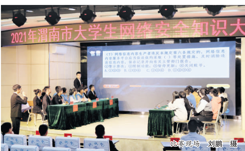
比赛现场

本报讯(通讯员 刘鹏)10月14日,由渭南市公安局主办、学校承办的2021年渭南市大学生网络安全知识大赛在学校临渭区报告厅举行,学校和来自渭南师范学院、渭南职业技术学院的共6支代表队参加了比赛。学校副校长蒋平江出席活动并致词。渭南市公安局副局长沈军、渭南市公安网安支队政委赵利军及渭南市网信办网络安全科科长王明涛等相关领导参加了活动。