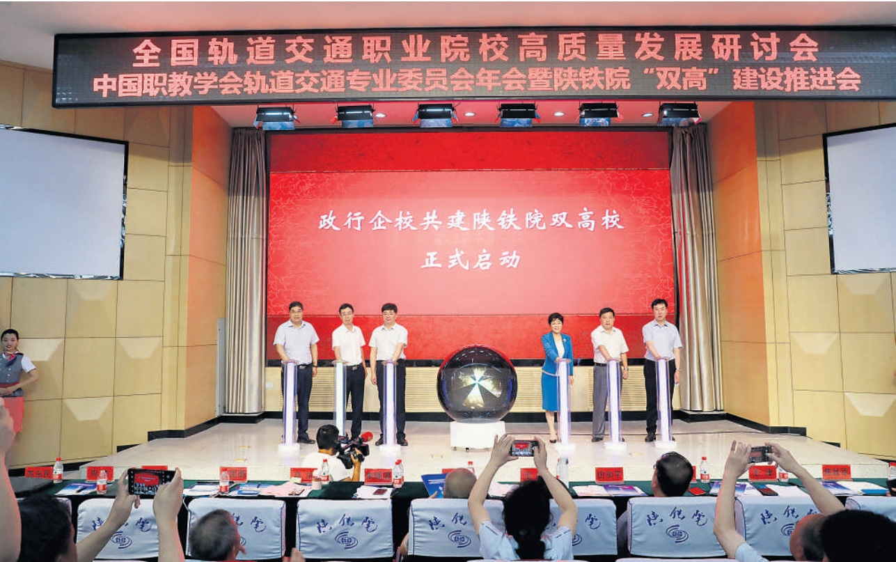
政行企校共建“双高”校