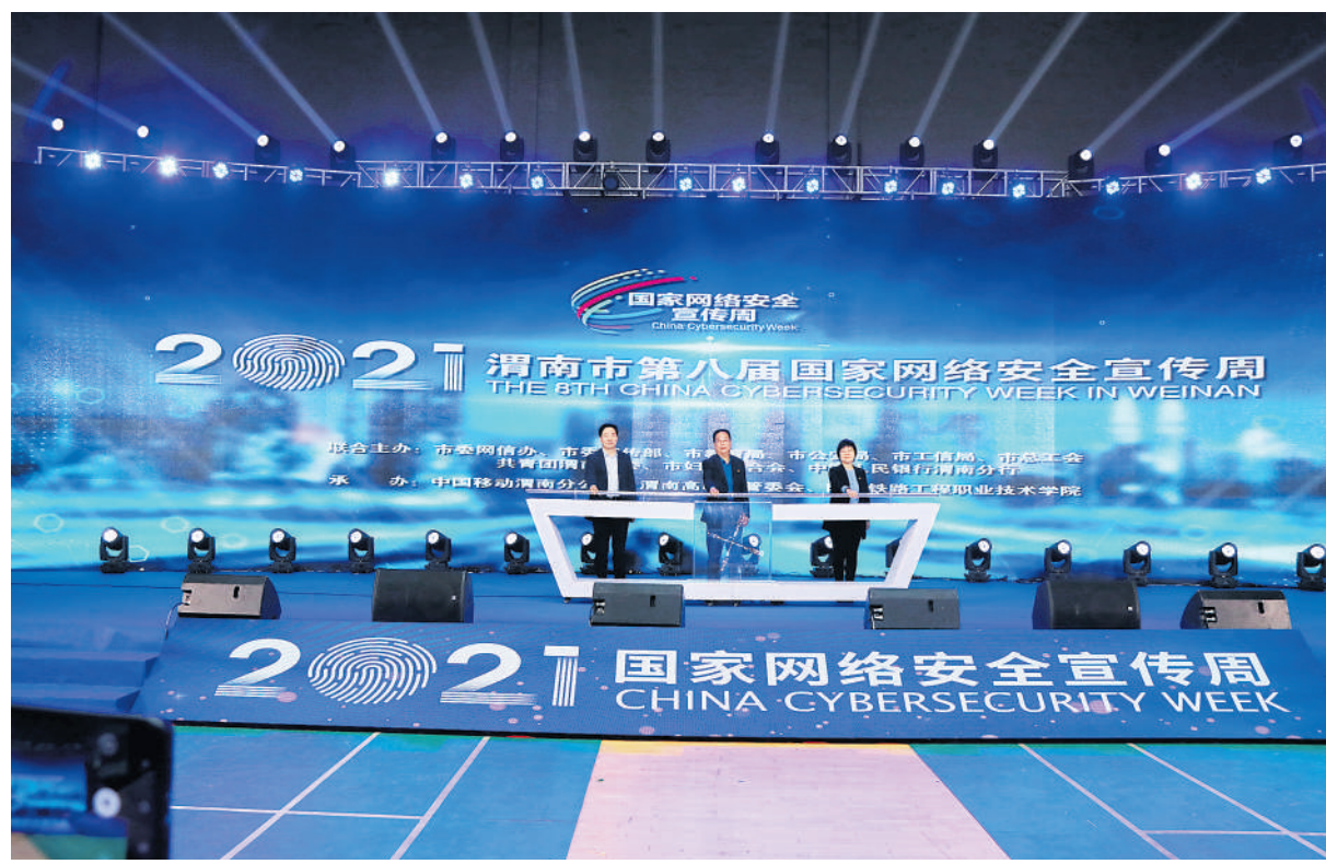
与会领导按下活动启动键